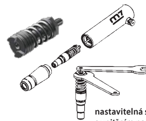
nastavitelná spojka s vnitřním nastavením

* spotřeba vzduchu je uvedena jako průměrná hodnota při práci s nářadím při tlaku 6,3 bar a rozumí se ve stlačeném stavu