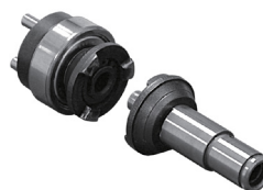
pozitivní spojka bez nastavení

* spotřeba vzduchu je uvedena jako průměrná hodnota při práci s nářadím při tlaku 6,3 bar a rozumí se ve stlačeném stavu