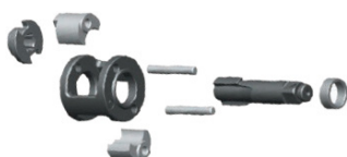
dvojitý příklep „twin dog“